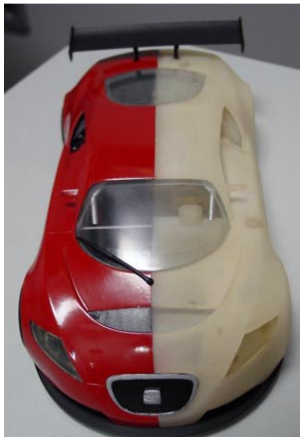
Estereolitografía pintada (SLA, Tecnitoys-Scalextric).