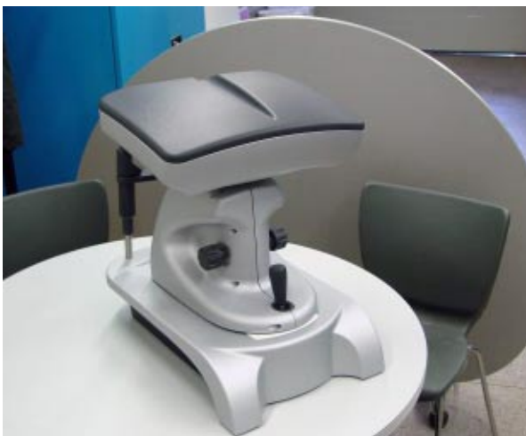
Ejemplo de desarrollo completo: diseño, prototipos y serie (corta).

R.A.: Estamos en el tramo intermedio entre el que piensa la pieza o la desarrolla y el que la produce; aunque muchas veces, como hemos comentado, hacemos directamente la serie final.