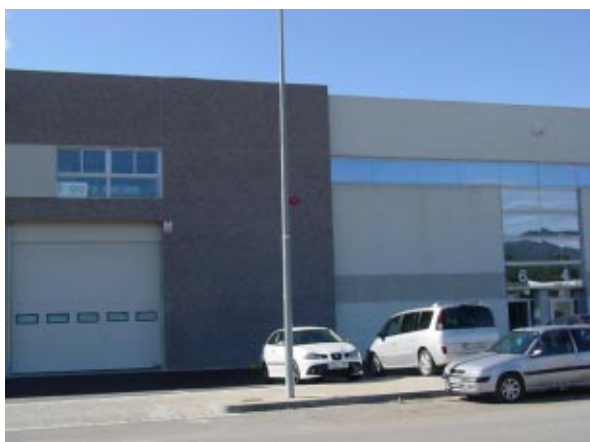
Nuevas instalaciones de Ineo Prototipos en Terrassa (Barcelona).