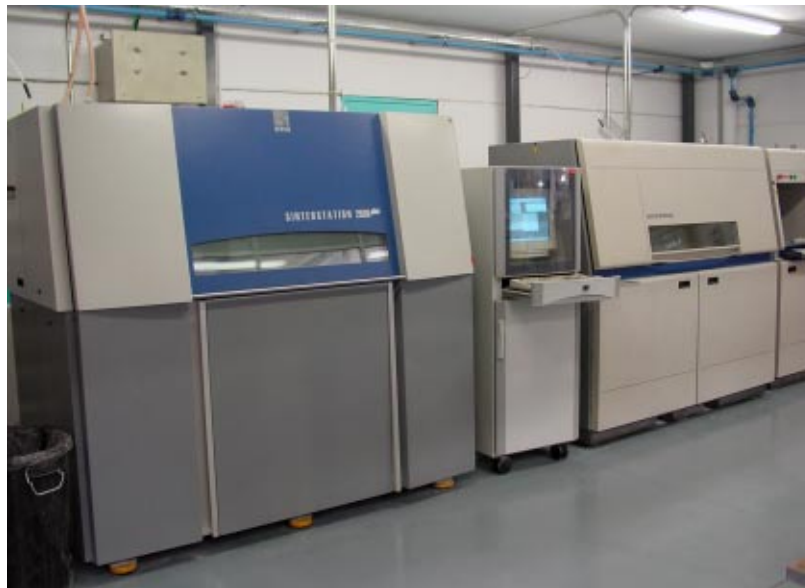
Máquinas SLS (DTM 2000 y 2500+).

R.A.: No es necesario estar cerca. Es cierto que el cliente, por comodidad, tiende a la proximidad, pero nosotros tenemos clientes en Andalucía, Galicia, Asturias o País Vasco. E incluso hemos enviado piezas a Holanda e Inglaterra que han llegado antes de las 10 de la mañana del día siguiente del envío.