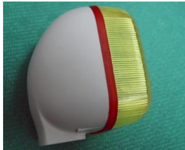
Pieza colada al vacío en dos materiales (carcasa intermitente).