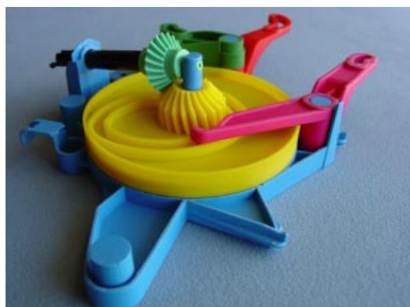
Mecanismo calefacción automóvil (Frape Behr). Piezas de PU con tratamiento térmico.

R.A.: Tenemos dos máquinas de sinterizado láser, cinco de vacío, una impresora Thermojet para realizar las piezas de cera para hacer posteriormente microfusión de aluminio y toda la maquinaria necesaria para el acabado de piezas, como cabinas de pintado de piezas, máquinas de chorro de arena, y un taller mecánico con torno, fresa, taladros, etc