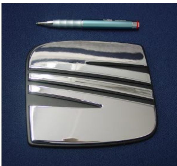
Piezas fabricadas por sinterización de poliamida (SLS).

En cuanto al motivo, ha sido principalmente una cuestión de espacio. Antes teníamos un espacio reducido donde trabajábamos once personas. Contábamos con dos almacenes y una nave alquilada a cinco kilómetros pero no era práctico. Ahora, con estas nuevas instalaciones de 1.000 metros cuadrados de nave, oficinas y plazas de aparcamiento, hemos mejorado notablemente nuestra estructura de trabajo, la logística y la gente trabaja mucho más cómoda. Ha sido una mejora muy grande y necesaria. Estamos muy contentos y somos muy optimistas.